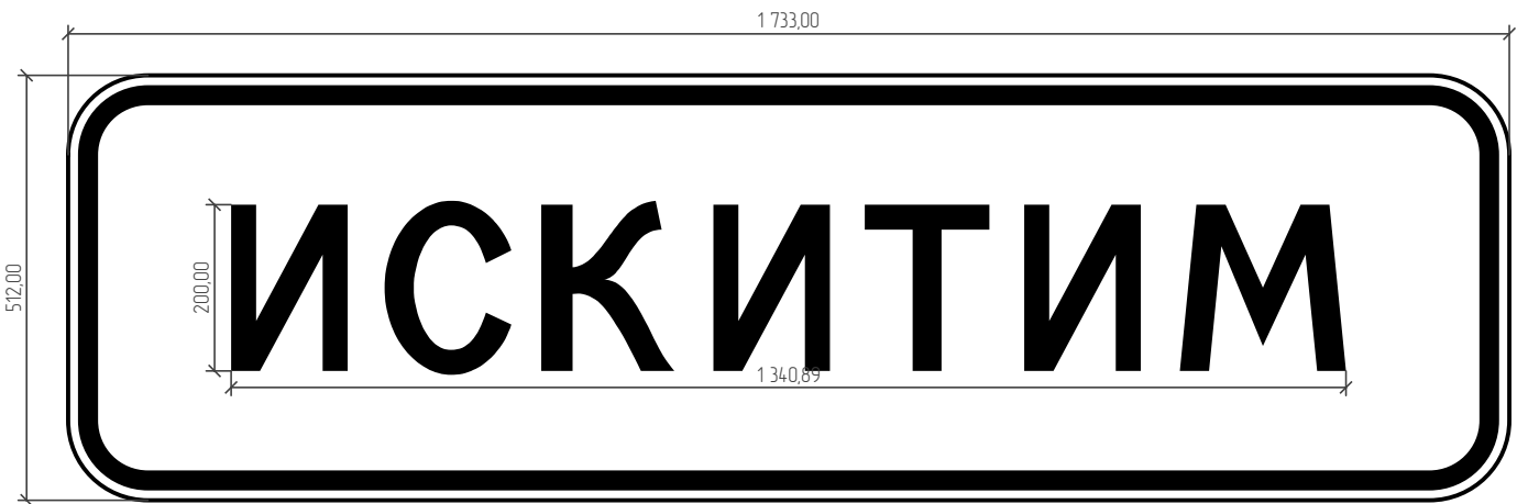
Таблица используемых букв и символов